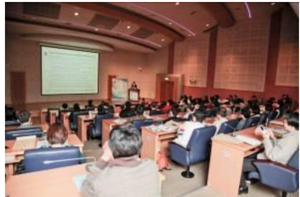
與會者用心聆聽演講