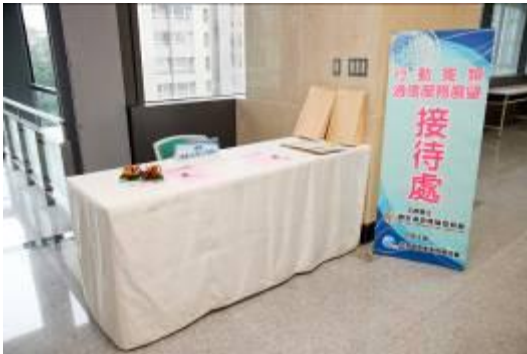
三樓與會者報到台