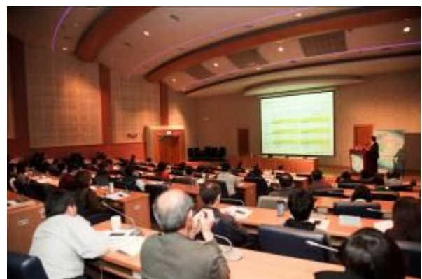
與會者用心聆聽演講