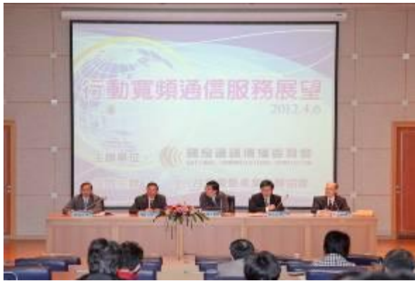
綜合座談主持人及與談人