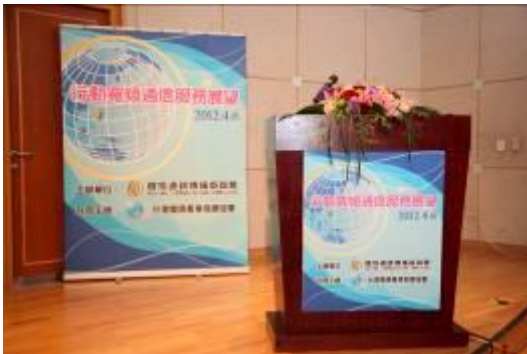
會議室內會場佈置