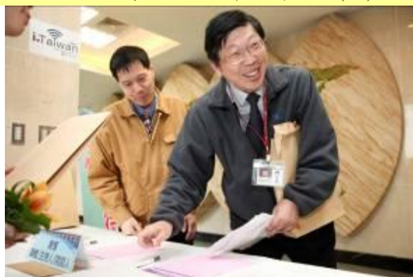
與會貴賓抵達會場